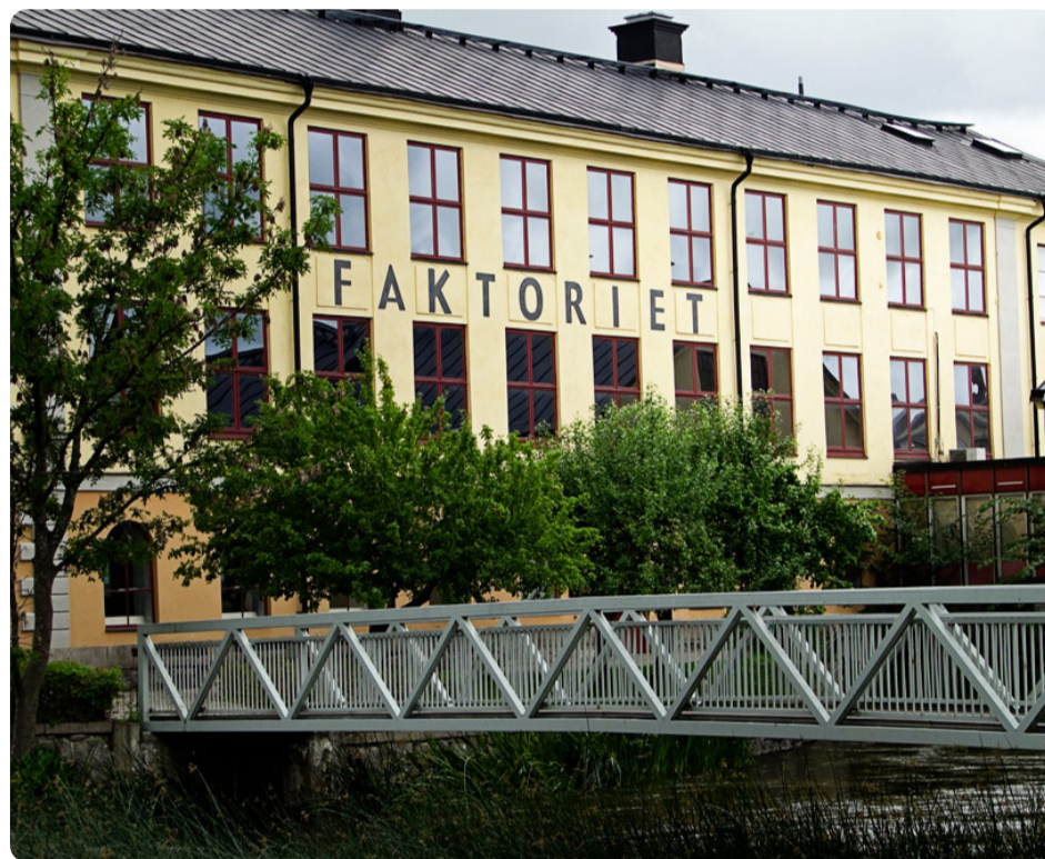
Centrumnära Faktoriet har flest ansökningar och en hög andel elever med högutbildade föräldrar.

Med motiveringen att minska segregationen lades högstadieskolan i Fröslunda ner 2010. 70 procent av eleverna hade utländsk bakgrund. Eleverna flyttades till Stålforssskolan som fick ett mycket större upptagningsområde. Många av eleverna var nyanlända. Som avlastning